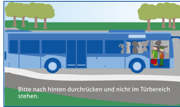
Bitte nach hinten durchrücken und nicht im Türbereich stehen.

damit der Schulweg oder auch Fahrten in der Freizeit reibungslos funktionieren, geben wir eine Übersicht mit Tipps und Hinweisen für ein sicheres Verhalten am und im Bus.