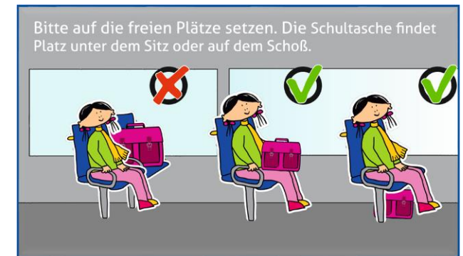
Bitte auf die freien Plätze setzen. Die Schultasche findet Platz unter dem Sitz oder auf dem Schoß.